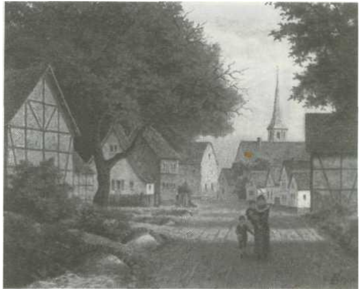
Malerisches Straßenbild in der oberen Annaberger Straße in Friesdorf, nach einem Gemälde von F. Böcker, 1904. Halblinks der Annaberger Bach, in der Mitte das Friesdorfer „Turmhaus“

Von anderen alten Adelshöfen, dem Piakenhof, später Burg oder Plettenberger Hof genannt, und dem Binsfelder Hof ist nichts mehr vorhanden. Von den schönen Fachwerkhäusern ist das bemerkenswerteste, dem Turmhaus gegenüber gelegen, dem Bombenangriff im letzten Krieg zum Opfer gefallen. Aber an der Annaberger- und Klufterstraße stehen heute noch ein paar alte Häuser, zum Teil von Weinlaub umrankt mit dem Giebel